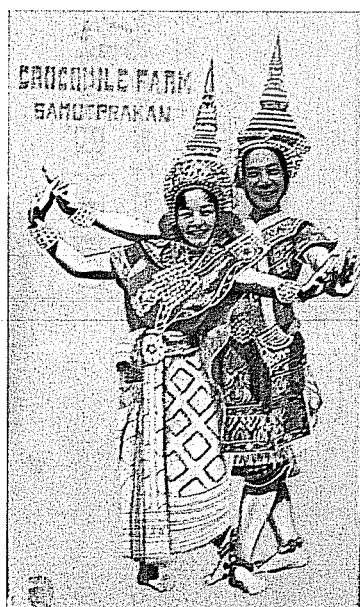
87 界最大美鱷魚湖泰國北境