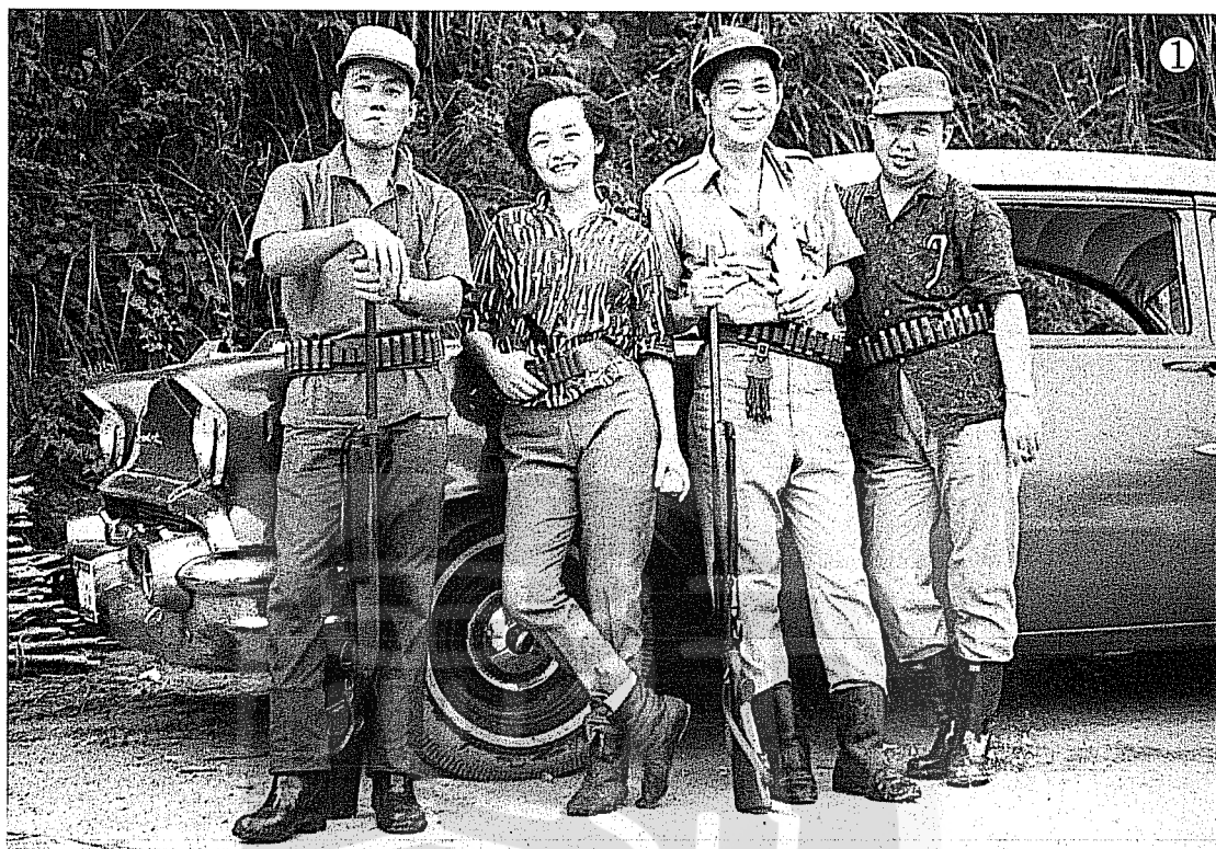
①酷愛戶外活動的牛哥牛嫂（右二、左二）與友人武俠小說名作家臥龍生（右）、司馬翎（左）合影。