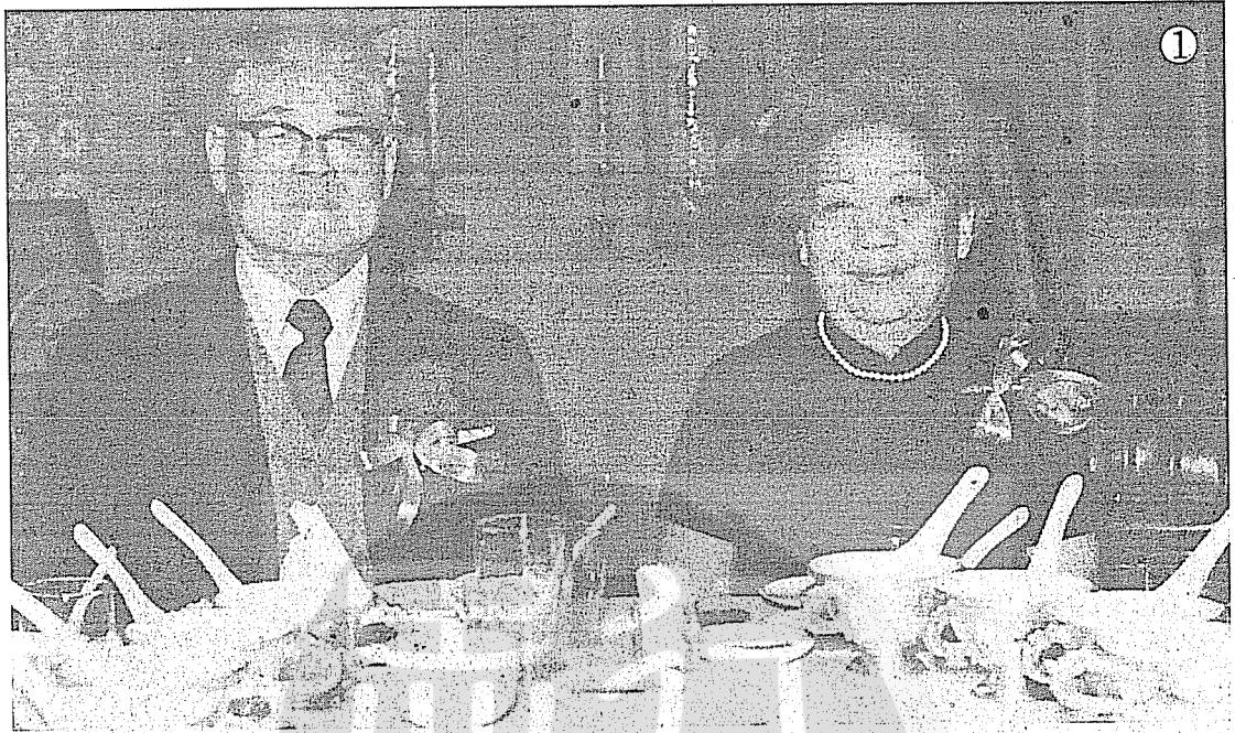
①孫連仲將軍八十大壽時與夫人合影。