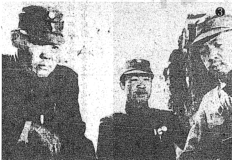
①一九四五年十二月蔣中正主席（左六）偕夫人蔣宋美齡女士（左七）巡視北平與孫連仲將軍（左三）等合影於太和殿。 ②一九三八年晉省戰役，孫連仲將軍（中）督戰前線時留影，左為田鎮南、右為傅印圖。 ③一九三八年三月台兒莊會戰時，孫連仲將軍（左）擔任第二集團軍總司令與卅一師師長池峰城（右）合影。