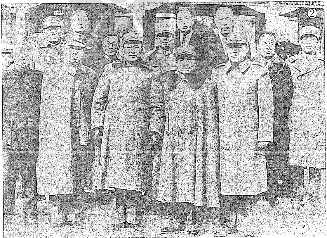
②抗戰勝利後，孫連仲將軍（前右一），與前排左起：熊斌、熊式輝、白崇禧、李宗仁等在北平合影。