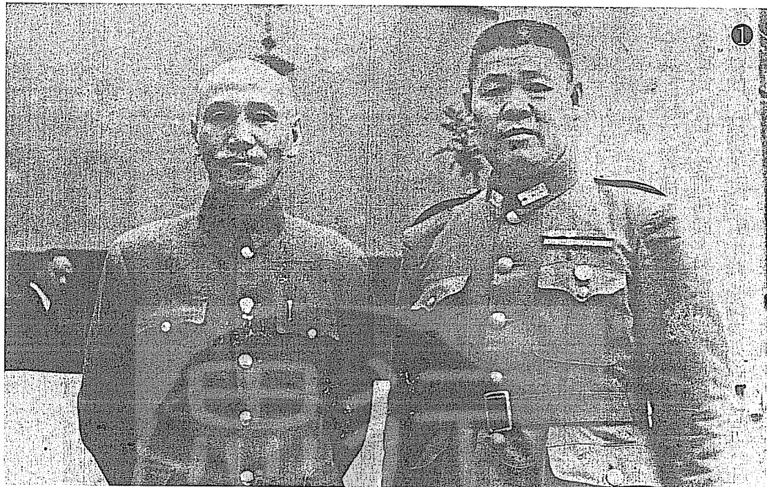
①一九六四年六月蔣中正主席親臨北平與孫連仲將軍（右）合影。