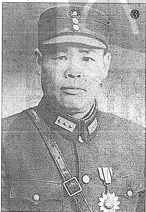
③孫連仲將軍於台兒莊戰役大捷後榮獲「青天白日勳章」。