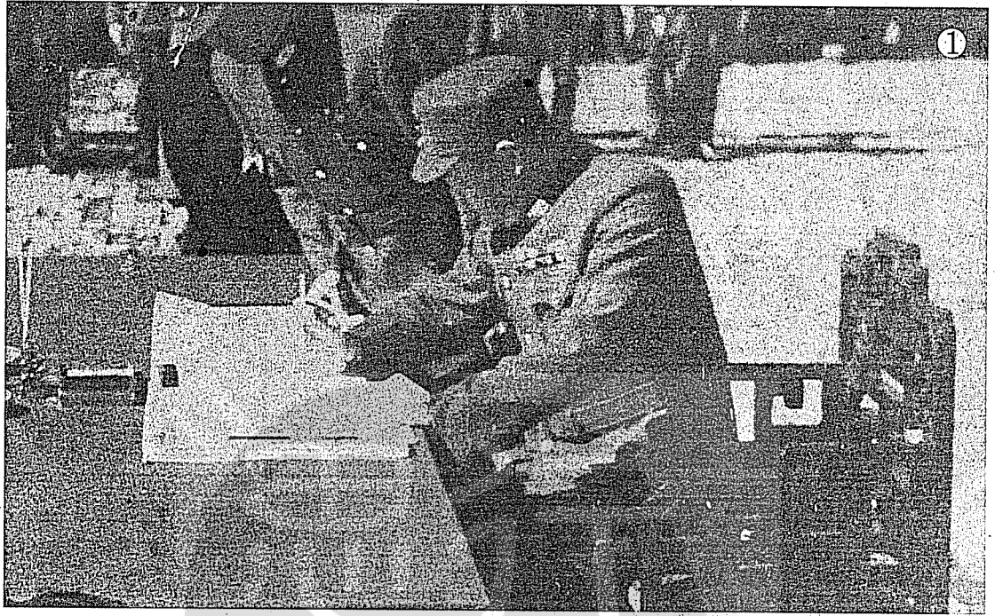
①一九四五年十月十日，孫連仲將軍代表中國於太和殿簽下受降書。