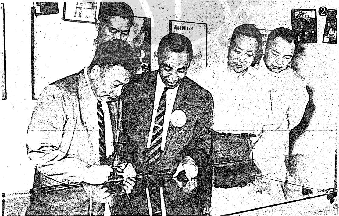
②台中教師會館落成後，蔣經國（前左）曾蒞臨巡視，適作者劉真廳長公出，乃派第五科科長陳志先（前左二）陪同參觀館中陳列文物。