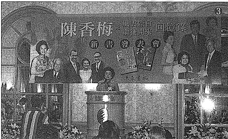
① 蔣緯國將軍主持台北新公園陳納德將軍紀念儀式。 ② 作者陳香梅（左二）早年與何應欽將軍（右二）及溫哈熊將軍夫人（右一）合影。 ③ 二〇〇二年陳香梅的回憶錄：（一）風雲際會、（二）繼往開來，在台北未來書城舉行新書發表會。