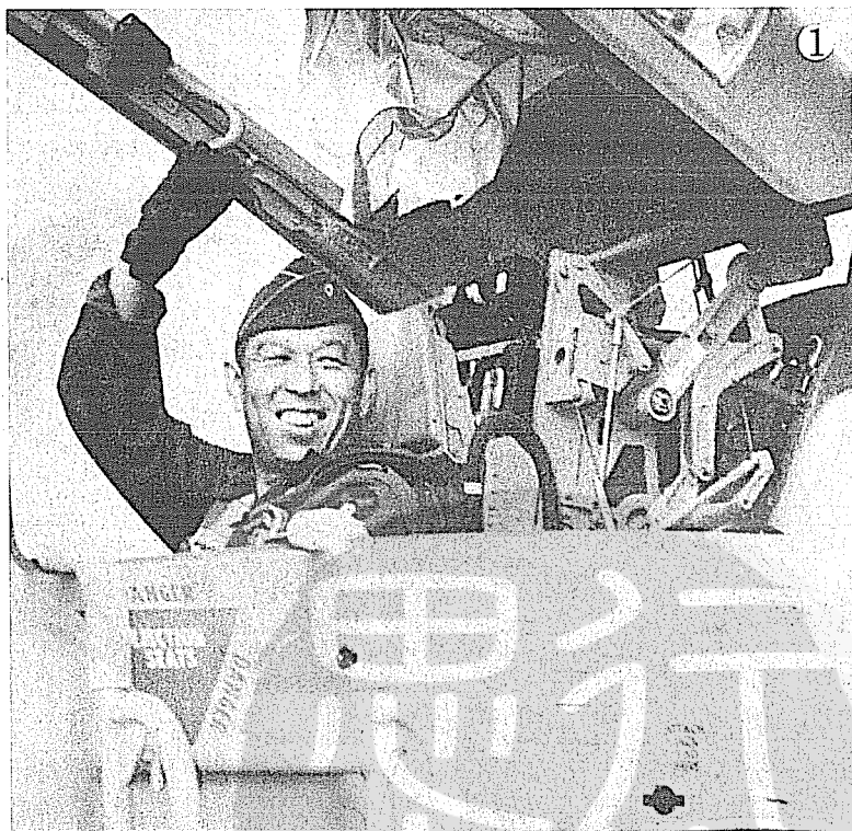
① 臧錫蘭將軍在噴氣機上留影。 ② 臧錫蘭將軍（右二）早年陪同國防部長蔣經國（左二）視察台南基地，左為徐煥昇總司令。