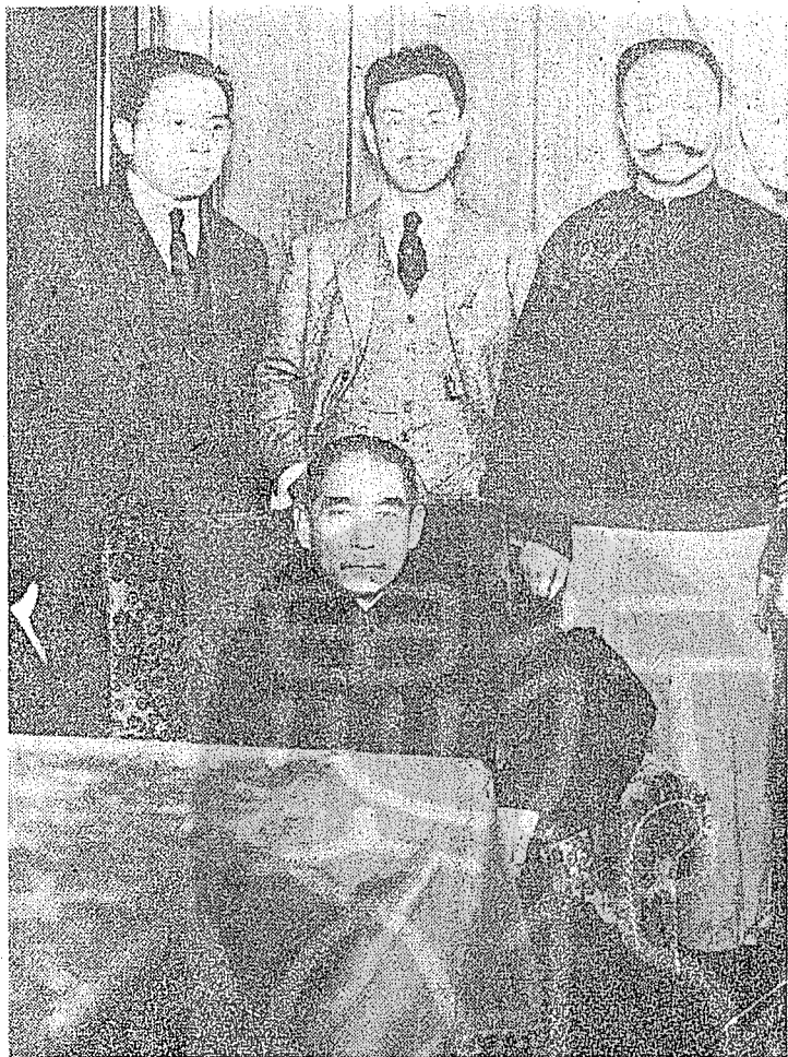
民國十三年 國父與戴傳賢（二排中）李烈均（右）等合影。

的是「紀侯大去其國」，根據公羊傳的解釋，以為襄公九世祖，曾經被紀侯的先祖所讒殺，襄公滅紀，乃報九世之仇，春秋不記作襄公滅紀，而言「紀侯大去其國」，這顯然寓有贊美襄公之意，所以這種復仇的思想，是孔子所承認的大義，因此這恰好作為革命排滿與漢的理論根據，而抗日復國自不在話下了。季師的提倡公羊學是懷有一腔的國家民族的情緒的，這與同時的陳布雷先生的議論實相呼應，不愧稱為政壇雙壁，筆者何幸，能親炙其言論風彩。