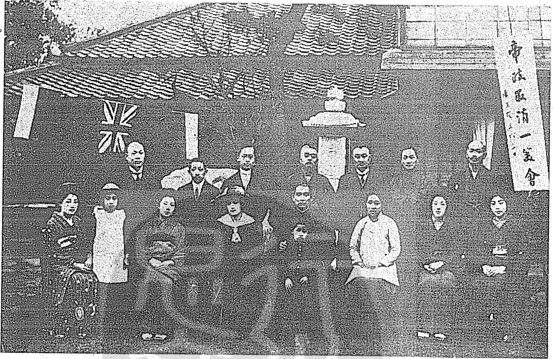
(上圖) 民國五年袁世凱宣佈取消帝制 國父偕夫人在東京 與日本友人合影。二排右起第二人為戴傳賢先生。