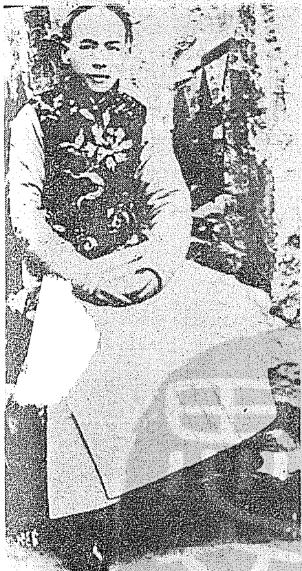
與鍾榮光在嶺南大學前身格致書院之同學好友革命先烈史堅如遺照。

榮光弱冠即舉於鄉，文名藉甚，風流倜儻，清末士夫舊習，殆皆深染。自與西方思潮接觸，於一八九九年皈依基督，在香港道濟會堂領受洗禮；返廣州後，即遣散妾侍，資助其受新教育而另嫁。一九一四年，元配何氏逝世，翌歲在美與其堂妹鍾芬庭結合，頗受時人及戚族所指摘。榮光謂今世男女自由相愛結婚，乃當事人兩下私事，於局外人何干。而此一嘗受社會戲稱「鍾鍾氏