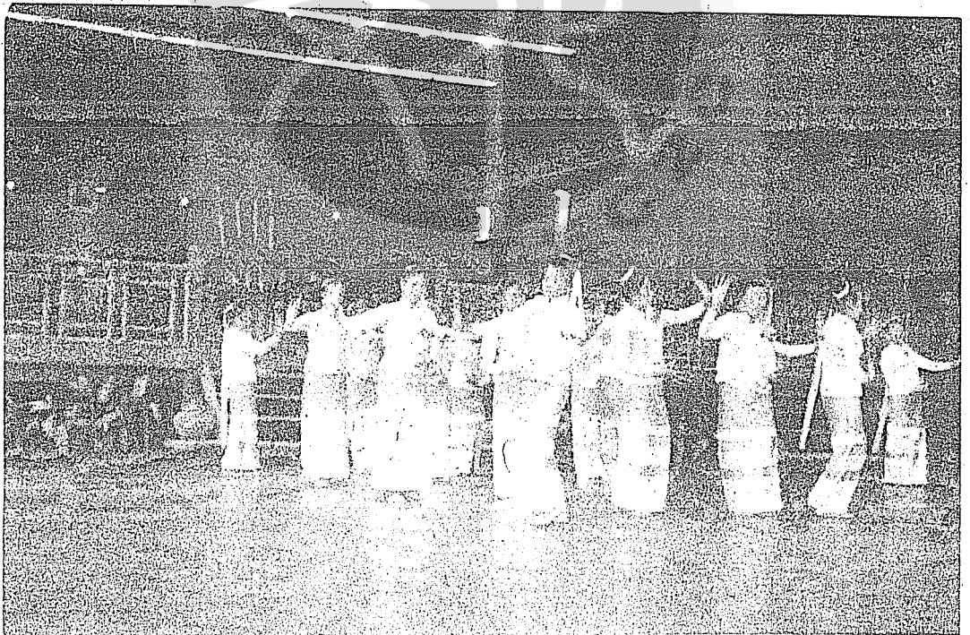
舞 風 土 之 園 瑰 玫 谷 曼 國 泰