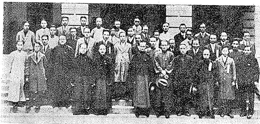
會育教僑華與（八—第起左排前）生先民漢胡月一十年八十八國民華中 。影合員八席出

在以為將來，為達成社會國家擔當鉅任的願望，必須具備忍辱負重的精神。(四)關於思想的——學生應具有正確之思想，方能形成其高尚之理想，至於高尚其理想之方法則在於潛心靜氣於義理之中，不馳逐於流俗之世界，蓋「理想注於親愛，則殘酷之念不得而參之；注於篤實，則虛妄之