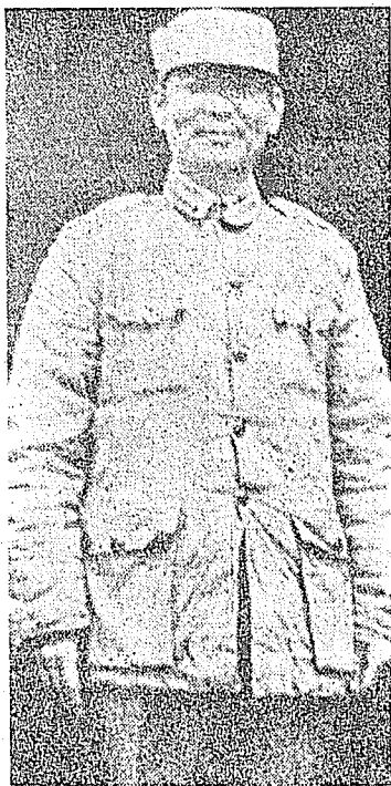
民國三十八年十月二十六日上午十時到達金門前線，十一月一日就任金門防衛司令官的胡璉將軍。

，父親召見湯恩伯總司令，及閩省主席朱一民氏。下午五時，以中國國民黨總裁身分，召集閩南各軍師長以上本黨籍之高級將領開會，討論防衛辦法。「十月二日，湯總司令由廈門來電，以李宗仁反對其任閩省主席之聲明，使其喪失威信，……父親甚表同情，且以湯總司令正在與當面共匪拚命作戰之時，不可走馬換將，應即設法勸慰，俾得繼續作戰。」十月七日，……上午十時三十分，船抵廈門。在港口即聞大陸匪砲隆隆作響，此地與匪軍相隔不及九千米，父親身繫國家安危，竟如此冒險犯難，亦無非為國家盡最後之心力耳。下午四時登岸，父親即在湯總司令寓所召集團長以上人員加以慰勉，并會見當地紳耆，八時後回船，與湯總司令話別，再予以勸慰鼓勵。……」十月二十二日，金門島離大陸陣地，不過一衣帶水，國軍退守此地之後，父親以其對軍事和政治均具極大意義，必須