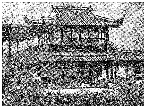
（上圖）徐悲鴻早年喜歡收集的香烟盒畫片（下圖）徐悲鴻利用暑假認真作畫的場所哈同花園。