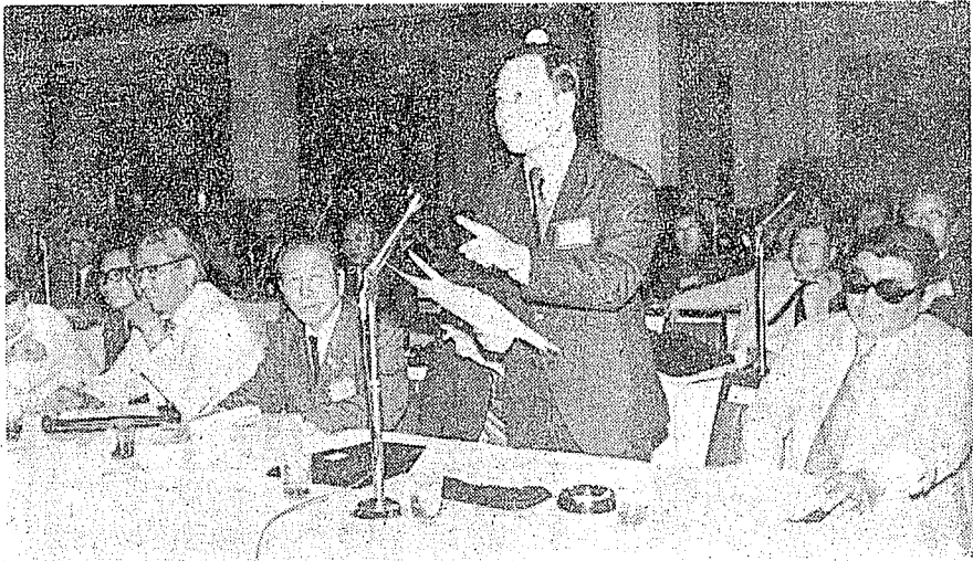
本文作者在全世界蒙胞反共愛國會議中發言時留影。

由於這次會議的成功，使海外蒙胞了解非團結無以表現反共力量，所以海外蒙胞就以這次會議的成就為基礎，於民國六十三年八月九日至十一日，又在美國首都華盛頓召開「全蒙反共會議」